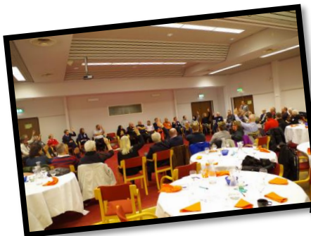
Lokal överenskommelse i Helsingborg